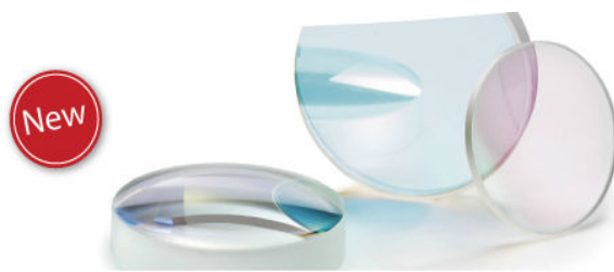
新製品 1um用高品質光学部品