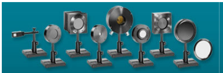
オフィール社のパワーメータ